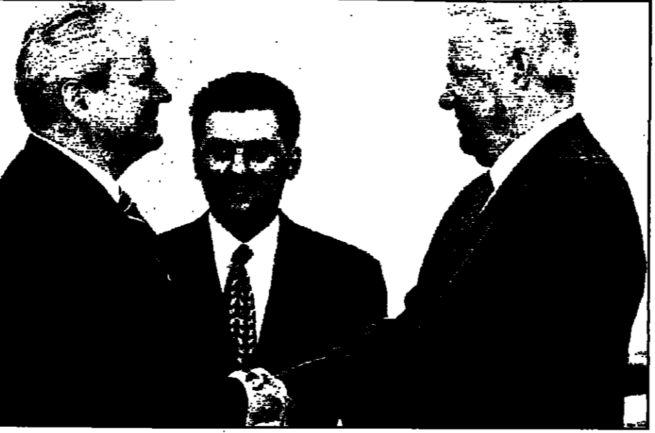
الرئيس الروسي بوريس يلتسين يستقبل نظيره اليوغسلافي سلوبودان ميلوسيفيتش في الكرملين أمس

■ موسكو، 17 يونيو: أعلن الرئيس الروسي بوريس يلتسين تعهد ميلوسيفيتش بالتفاوض مع ألبان كوسوفو جدد معارضته التدخل العسكري في الاقليم. وأكد يلتسين أن روسيا ستدعم المفاوضات بين الجانبين.